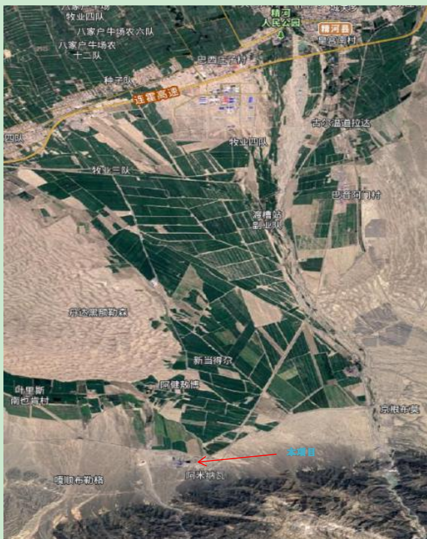
图 2.1-1 地理位置示意图

(3) 项目地理位置：项目位于精河县西南约 20km 处，原精河县工业园，北距精河南干渠约 150m，南距精伊霍铁路约 500m。厂区中心地理坐标：经度：82.82705426，纬度：44.39821417。