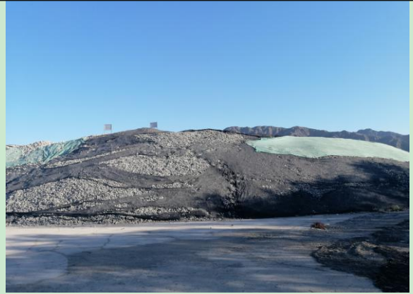
石灰石原料堆放场